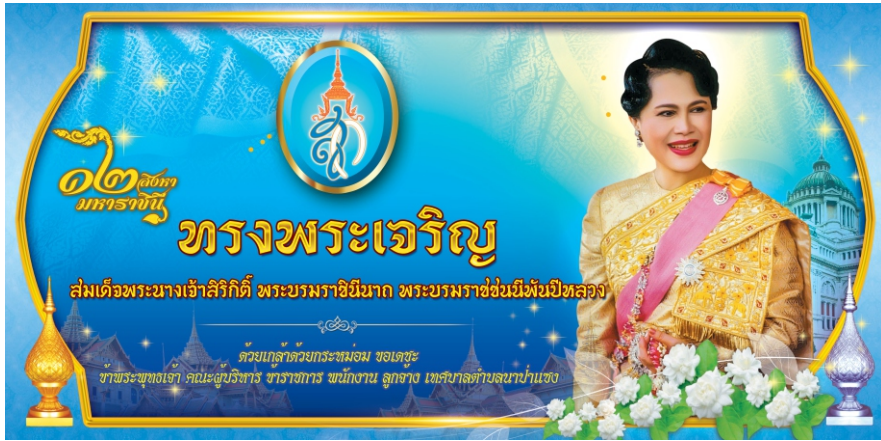
จากใจ...บรรณธิการ..