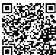
ส่งใบสมัคร